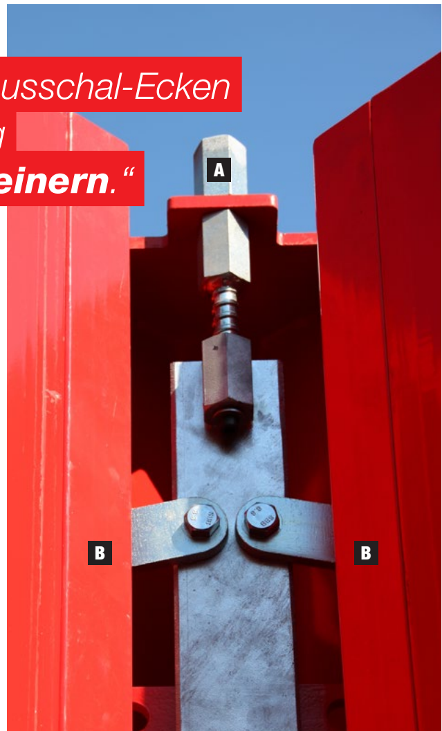
Abb. 1 Sechskantmutter (A) und bewegliche Schenkel (B)